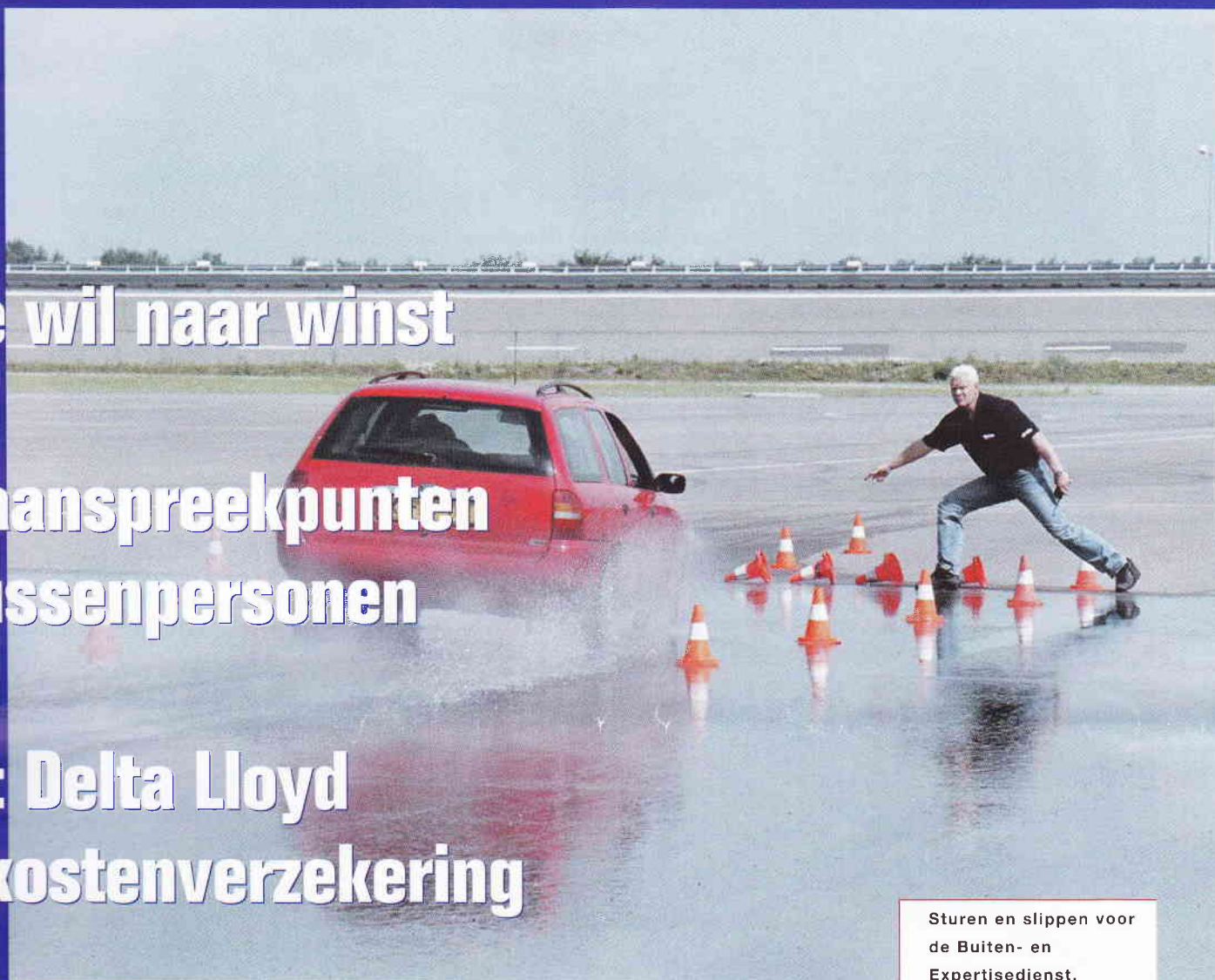
Sturen en slippen voor de Buiten- en Expertisedienst.

Nieuw: Delta Lloyd ziektekostenverzekering